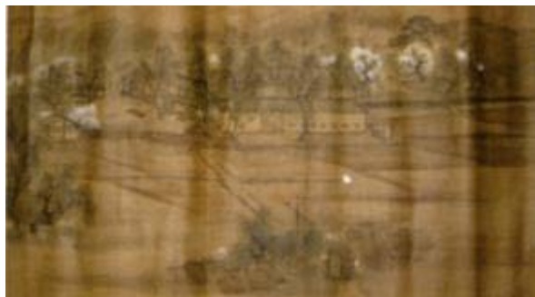
星野文良画（企画展図録より）

この度発行された広島県立歴史博物館平成24年度夏の企画展図録『菅茶山と化政文化を彩る7人の巨人たち』で、蠣崎波響画「黄葉夕陽村舎図」が掲載された。図録ではこの図に類似する資料が4点あることが紹介されている。蠣崎波響画以外では、星野文良画であり、「□雪」と記した画人であり、四人目は筆者が昭和51年(1976)「菅茶山とその弟子たち」(図録)を製作した際、廉塾の当主から示された写真版の画である。蠣崎波響画以外の三点は廉塾伝来資料である。但し、図録では「□雪」の画は紹介されていないので、「□雪」以外の三図に共通していることは構図や絵柄