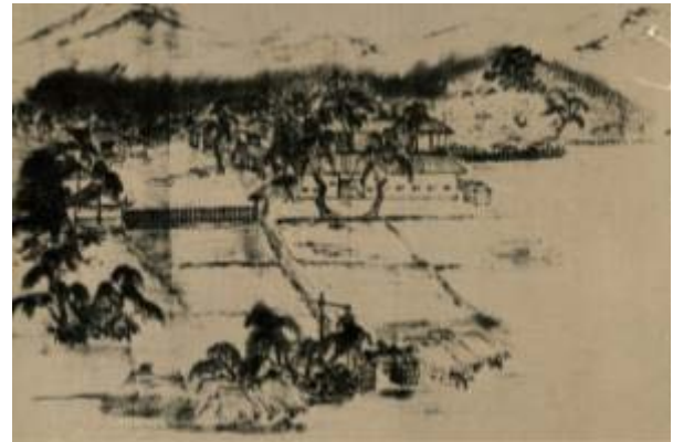
作者不明・写真版（神辺郷土史研究会図録より）

この度発行された広島県立歴史博物館平成24年度夏の企画展図録『菅茶山と化政文化を彩る7人の巨人たち』で、蠣崎波響画「黄葉夕陽村舎図」が掲載された。図録ではこの図に類似する資料が4点あることが紹介されている。蠣崎波響画以外では、星野文良画であり、「□雪」と記した画人であり、四人目は筆者が昭和51年(1976)「菅茶山とその弟子たち」(図録)を製作した際、廉塾の当主から示された写真版の画である。蠣崎波響画以外の三点は廉塾伝来資料である。但し、図録では「□雪」の画は紹介されていないので、「□雪」以外の三図に共通していることは構図や絵柄