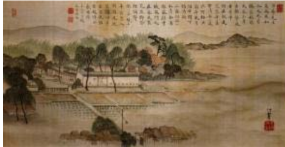
蠣崎波響画（企画展図録より）